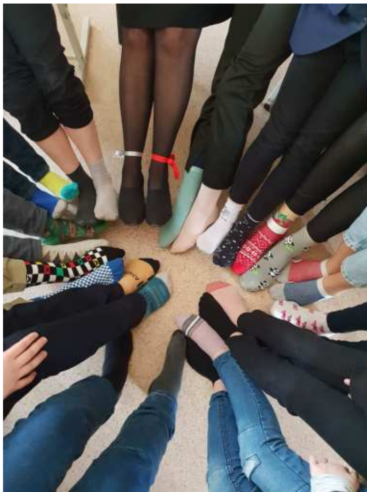
Cała społeczność gimnazjum wzięła udział w akcji „Tydzień Kolorowych Uczuć” oraz „Kolorowe Skarpetki”

W ramach zajęć prewencyjnych filię naszego Gimnazjum w Duksztach odwiedziły funkcjonariuszki z Komisariatu Policji Rejonu Wileńskiego, które poprowadziły z uczniami szkolenie na temat „Komunikacja interpersonalna i sposoby radzenia sobie z przemocą”. Uczniowie działu edukacji przedszkolnej i wczesnoszkolnej „Motylki” i „Pszczółki” wykonali bransoletki i widokówki, które sprezentowali przyjaciołom z innej grupy.