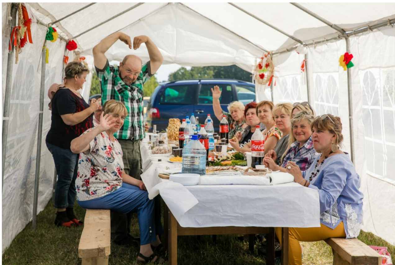
Zagroda gminy Suderwa

W ciągu dwóch dni zlotu rodzinnego jego uczestnicy wezmą udział między innymi w sztafetach sportowych, konkursie wiedzy o Wileńszczyźnie. Zostanie także wyłoniona najładniejsza zagroda.