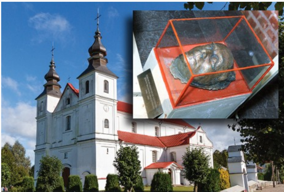
Pod głównym ołtarzem katedry we Worniach, u wezłowania grobów ze szczątkami biskupów żmudzkich znajduje się jedna z trzech pośmiertnych masek Jerzego Giedroycia, twórcy paryskiej „Kultury”

Syjamska zażyłość litewskiej kultury z polską, o czym już pisaliśmy przed tygodniem, wywodzi się nie (tylko) z bliskości obydwu narodów, które przez wieki były w spójnym i wspólnym organizmie państwowym, bo na tym obszarze kulturowym symbioza ta jest też wyrazem podwójnej jaźni twórczej polskich i litewskich, a raczej polsko-litewskich działaczy kultury.