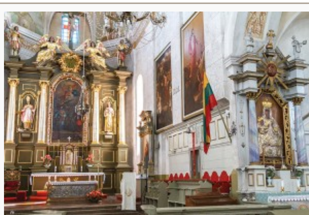
Zawieszona nad głównym ołtarzem flaga litewska ma chyba świadczyć, że symbioza dwóch onegdaj zażytych pierwiastków jest już przeszłością