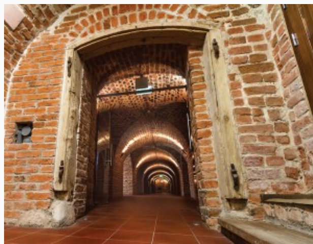
Budynek kolegium w Krożach stoi na twardych i mocnych do dziś fundamentach z okresu Rzeczypospolitej Obojga Narodów

Tymczasem widzimy, że ich rozdwojenie czasami może przejawiać się ostrą schizofrenią kulturową, negującą i odrzucającą swoje bliźniacze jestestwo. Ta patologia może z kolei prowadzić do nieważkości kulturowej, w której dziś próbuje się osadzać rozerwaną i podzieloną, często też przyswojoną, lecz nieoswojoną, wspólną twórczość. Historia wielu narodów aspirujących do „wielkich” dowodzi jednak, że w próżni nie da się postawić trwałych fundamentów twórczej chwały narodu.