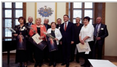
Uroczystość 5-lecia działalności PUTW w Solecznikach

Aktywnych seniorów, zrzeszonych w Polskim Uniwersytecie Trzeciego Wieku w Solecznikach (PUTW) można spotkać wszędzie: na uroczystościach państwowych i rocznicowych, na lokalnych imprezach w rejonie solecznickim, na koncertach w Wilnie, podczas społecznych akcji. Zapału, werwy i energii, połączonych z życiową mądrością i doświadczeniem mógłby im pozazdrościć niejeden młody człowiek. Obchody piątej rocznicy działalności studenci-seniorzy zorganizowali w Pałacu Balińskich w Jaszunach.