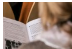
Konferencja naukowa "Dwujęzyczni pisarze polscy i litewscy. Zagadnienia bilingwizmu w kulturze polskiej i litewskiej. Literatura - kultura - język", fot. wilnoteka.lt/Bartosz Frątczak