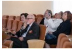
Konferencja naukowa "Dwujęzyczni pisarze polscy i litewscy. Zagadnienia bilingwizmu w kulturze polskiej i litewskiej. Literatura - kultura - język"