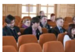
Konferencja naukowa "Dwujęzyczni pisarze polscy i litewscy. Zagadnienia bilingwizmu w kulturze polskiej i litewskiej. Literatura - kultura - język", fot. wilnoteka.lt/Bartosz Frątczak