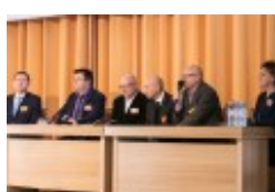
Konferencja naukowa "Dwujęzyczni pisarze polscy i litewscy. Zagadnienia bilingwizmu w kulturze polskiej i litewskiej. Literatura - kultura - język"