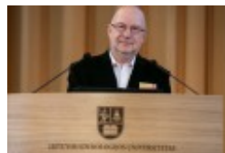
Konferencja naukowa "Dwujęzyczni pisarze polscy i litewscy. Zagadnienia bilingwizmu w kulturze polskiej i litewskiej. Literatura - kultura - język"