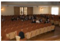
Konferencja naukowa "Dwujęzyczni pisarze polscy i litewscy. Zagadnienia bilingwizmu w kulturze polskiej i litewskiej. Literatura - kultura - język"