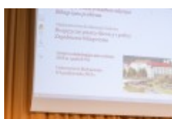
Konferencja naukowa "Dwujęzyczni pisarze polscy i litewscy. Zagadnienia bilingwizmu w kulturze polskiej i litewskiej. Literatura - kultura - język"