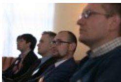
Konferencja naukowa "Dwujęzyczni pisarze polscy i litewscy. Zagadnienia bilingwizmu w kulturze polskiej i litewskiej. Literatura - kultura - język"