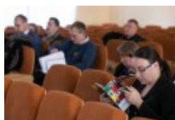
Konferencja naukowa "Dwujęzyczni pisarze polscy i litewscy. Zagadnienia bilingwizmu w kulturze polskiej i litewskiej. Literatura - kultura - język", fot. wilnoteka.lt/Bartosz Frątczak