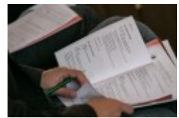
Konferencja naukowa "Dwujęzyczni pisarze polscy i litewscy. Zagadnienia bilingwizmu w kulturze polskiej i litewskiej. Literatura - kultura - język"