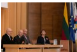
Konferencja naukowa "Dwujęzyczni pisarze polscy i litewscy. Zagadnienia bilingwizmu w kulturze polskiej i litewskiej. Literatura - kultura - język"