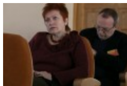
Konferencja naukowa "Dwujęzyczni pisarze polscy i litewscy. Zagadnienia bilingwizmu w kulturze polskiej i litewskiej. Literatura - kultura - język", fot. wilnoteka.lt/Bartosz Frątczak