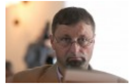
Konferencja naukowa "Dwujęzyczni pisarze polscy i litewscy. Zagadnienia bilingwizmu w kulturze polskiej i litewskiej. Literatura - kultura - język"