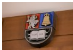
Konferencja naukowa "Dwujęzyczni pisarze polscy i litewscy. Zagadnienia bilingwizmu w kulturze polskiej i litewskiej. Literatura - kultura - język", fot. wilnoteka.lt/Bartosz Frątczak