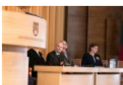
Konferencja naukowa "Dwujęzyczni pisarze polscy i litewscy. Zagadnienia bilingwizmu w kulturze polskiej i litewskiej. Literatura - kultura - język", fot. wilnoteka.lt/Bartosz Frątczak