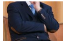
Konferencja naukowa "Dwujęzyczni pisarze polscy i litewscy. Zagadnienia bilingwizmu w kulturze polskiej i litewskiej. Literatura - kultura - język", fot. wilnoteka.lt/Bartosz Frątczak