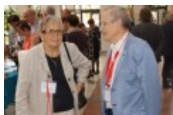
Międzynarodowa Konferencja Medyczna pt. "Historia medycyny wileńskiej"