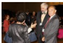
Międzynarodowa Konferencja Medyczna pt. "Historia medycyny wileńskiej"