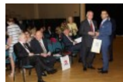
Międzynarodowa Konferencja Medyczna pt. "Historia medycyny wileńskiej"