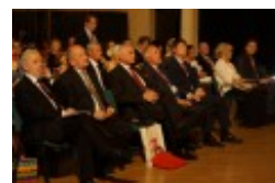
Międzynarodowa Konferencja Medyczna pt. "Historia medycyny wileńskiej"