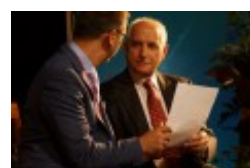
Międzynarodowa Konferencja Medyczna pt. "Historia medycyny wileńskiej"