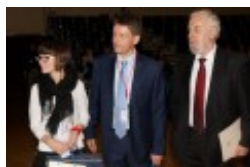
Międzynarodowa Konferencja Medyczna pt. "Historia medycyny wileńskiej"