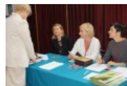
Międzynarodowa Konferencja Medyczna pt. "Historia medycyny wileńskiej"