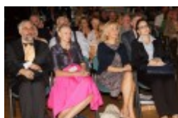
Międzynarodowa Konferencja Medyczna pt. "Historia medycyny wileńskiej"