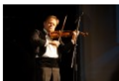
Międzynarodowa Konferencja Medyczna pt. "Historia medycyny wileńskiej"