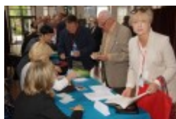
Międzynarodowa Konferencja Medyczna pt. "Historia medycyny wileńskiej"