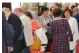
Międzynarodowa Konferencja Medyczna pt. "Historia medycyny wileńskiej"