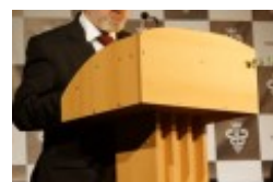
Międzynarodowa Konferencja Medyczna pt. "Historia medycyny wileńskiej"