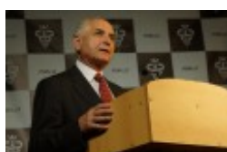
Międzynarodowa Konferencja Medyczna pt. "Historia medycyny wileńskiej"