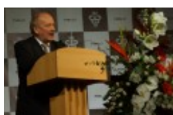
Międzynarodowa Konferencja Medyczna pt. "Historia medycyny wileńskiej"