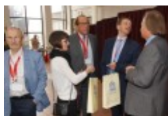
Międzynarodowa Konferencja Medyczna pt. "Historia medycyny wileńskiej"