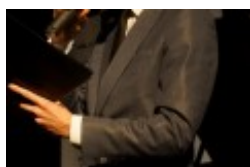
Międzynarodowa Konferencja Medyczna pt. "Historia medycyny wileńskiej"