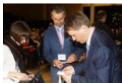
Międzynarodowa Konferencja Medyczna pt. "Historia medycyny wileńskiej"