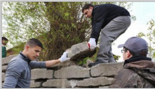
Rozbiórka muru z płyt nagrobnych

Harcerze przystąpili do rozbiórki muru z płyt nagrobnych, który odkryli wczesną wiosną w jednym z zaniedbanych podwórz przy ul. Algirdo w Wilnie. Stołeczny samorząd nie znalazł środków na prace likwidacyjne, więc w rozbiórce i wywiezieniu betonowych nagrobków pomagają pracownicy właściciela działki. Po zdokumentowaniu przez harcerzy trafią one do magazynów spółki samorządowej Grinda. Zostaną tam do czasu, aż historycy i specjaliści ds. ochrony zabytków ustalą, czy są to nagrobki z któregoś ze zniszczonych po II wojnie światowej cmentarzy, odpadki z fabryki,