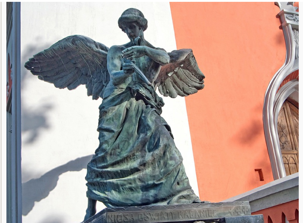
Nagrobek Józefa Montwiłła na Rossie