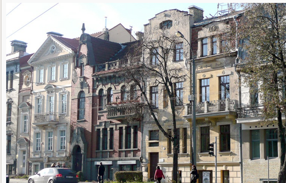
Fragment Kolonii Montwiłłowskiej przy placu Łukiskim