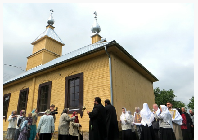
We wsi Gaj dokonano uroczystego poświęcenia odrestaurowanej cerkwi starobrzędowej pw. św. Nikołaja Cudotwórcy