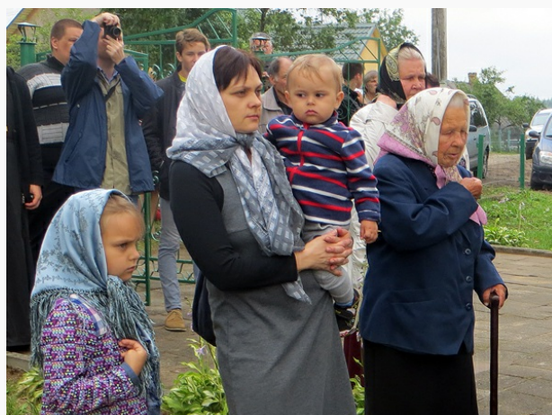
Widać tu też młodych wyznawców wiary

SPAUDOS, RADIJO IR TELEVIZIJOS RĖMIMO FONDAS