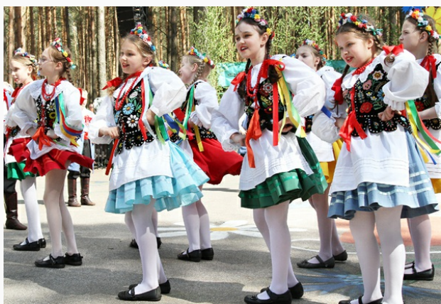
Fragment występu zespołu „Sto uśmiechów”

W piątek, 8 sierpnia, z Wilna do Polski wyrusza ekipa artystów oraz twórców ludowych, uczestniczących w 20. jubileuszowym Festiwalu Kultury Kresowej, którego oficjalne otwarcie nastąpi w Centrum Kultury Mragowa. Festiwal odbywa się pod honorowym patronatem małżonki prezydenta RP pani Anny Komorowskiej.