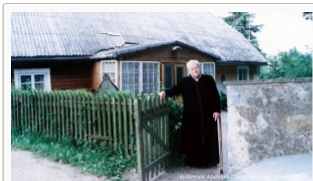
Życzeniem księdza prałata było, by w jego mieszkaniu, które żartobliwie nazywał „Pałacykiem”, powstało Muzeum Kapłanów Wileńszczyzny

Został pochowany przy kościele pw. Wniebowzięcia Najświętszej Maryi Panny w Mejszagole. Wielki kapłan i Polak, zawsze stojący na straży wiary i moralności, niezwykle serdeczny dla ludzi pozostawił po sobie testament – prosił nas, aby w naszych sercach płynęła miłość do Boga i szacunek wobec każdego człowieka. |