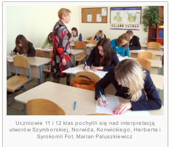
Uczniowie 11 i 12 klas pochylili się nad interpretacją utworów Szymborskiej, Norwida, Konwického, Herberta i Syrokomli

Zanim uczestnicy olimpiady przelewali swe myśli na