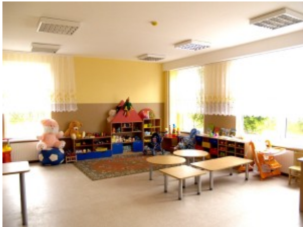
Żłobek-przedszkole w Niemenczynie

Trzy placówki przedszkolne rejonu wileńskiego: przedszkole „Pelėdziukas” w Pogirach, żłobek-przedszkole w Niemenczynie oraz żłobek-przedszkole w Mejszagole złożyły wnioski w celu uzyskania wsparcia unijnego na podstawie podziałania „Inwestycje w placówki nauczania przedszkolnego” 2 priorytetu „Dostępność i jakość usług publicznych: infrastruktura społeczna, oświatowa oraz ochrony zdrowia” Programu działań promowania spójności na I. 2007-2013.