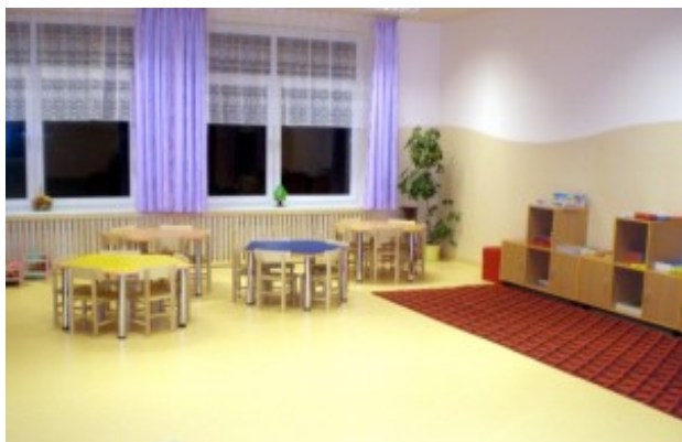
Żłobek-przedszkole w Mejszagole

Celem wspieranej finansowo ze środków funduszy strukturalnych UE działalności było odnowienie pomieszczeń oraz wyposażenia placówek nauczania przedszkolnego, mając na celu polepszenie jakości oraz dostępności świadczonych usług.