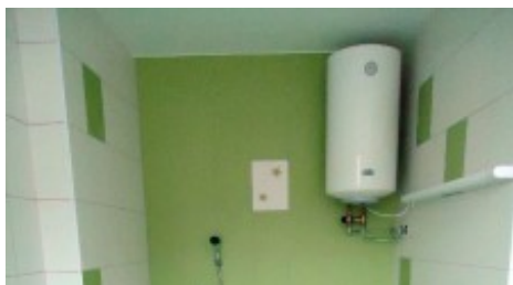
Przedszkole „Pelėdziukas” w Pogirach

Odnowienie przedszkola-żłobka w Niemenczynie opiewało na kwotę 406 tys. Lt (w tym środki pozyskane z funduszu UE – ponad 344 tys. Lt). Na realizację projektu w Niemenczynie samorząd przeznaczył 116 tys. Lt, przekraczając kwotę ustaloną w umowie o 55 tys. Lt (zgodnie z umową na realizację projektu samorząd miał przeznaczyć 61 tys. Lt).