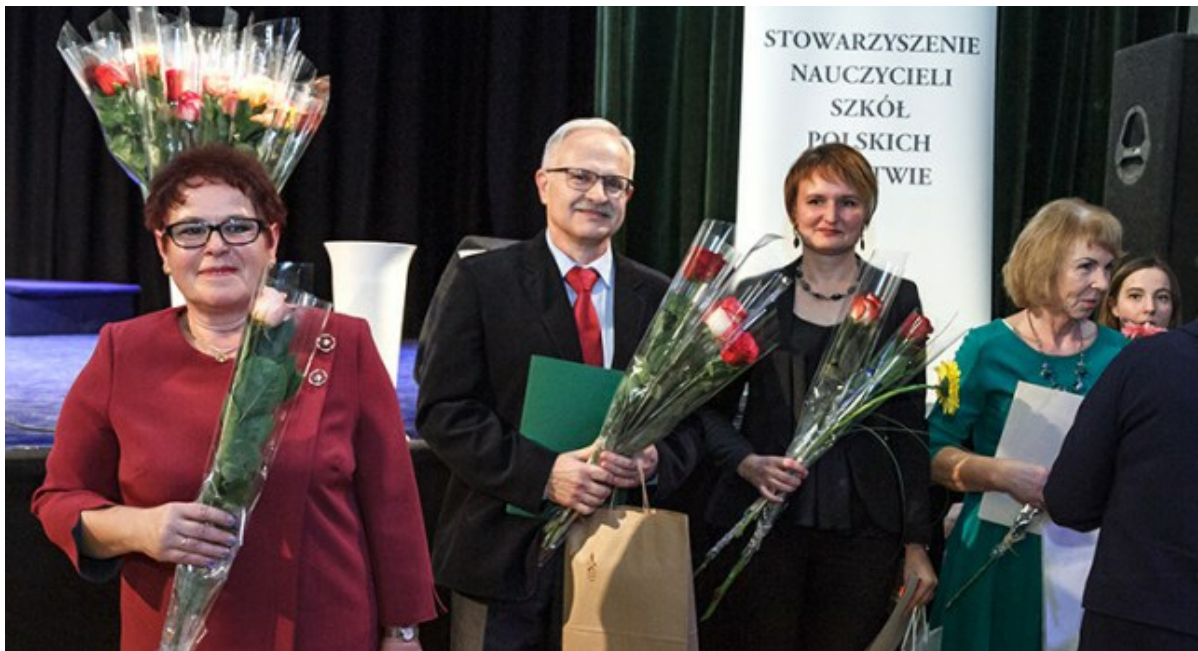
zkolnictwo polskie odnosi sukcesy dzięki systematycznej, mrowczej pracy nauczycieli

Mówiąc o problemach, dyrektor wspomniała o kwestii nauczania języka litewskiego w klasach początkowych.