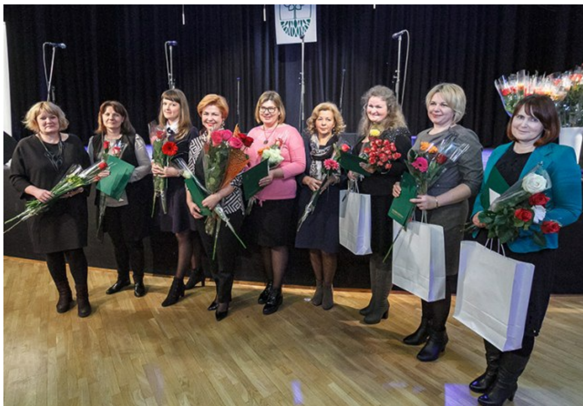
Kwiaty i gratulacje powędrowały do najlepszych nauczycieli polonistów

problemów, są podejmowane działania i liczymy, że w dialogu z partnerami litewskimi nastąpi wreszcie przełom w sprawach, które są kluczowe dla społeczności polskiej na Litwie” – zaznaczył kierownik wydziału konsularnego.