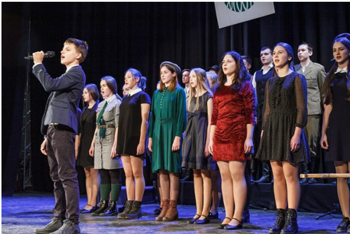
Nauczyciele mogli podziwiać wspaniałe występy w wykonaniu wychowanków z zespołu „Wilenka” z Gimnazjum. im. Wł. Syrokomli w Wilnie

Jak dodała, mimo że programy nauczania zostały ujednolicone, jednak uczniowie mają braki jeszcze z poprzednich lat, kiedy w programach nauczania była różna liczba godzin w polskich i litewskich szkołach.