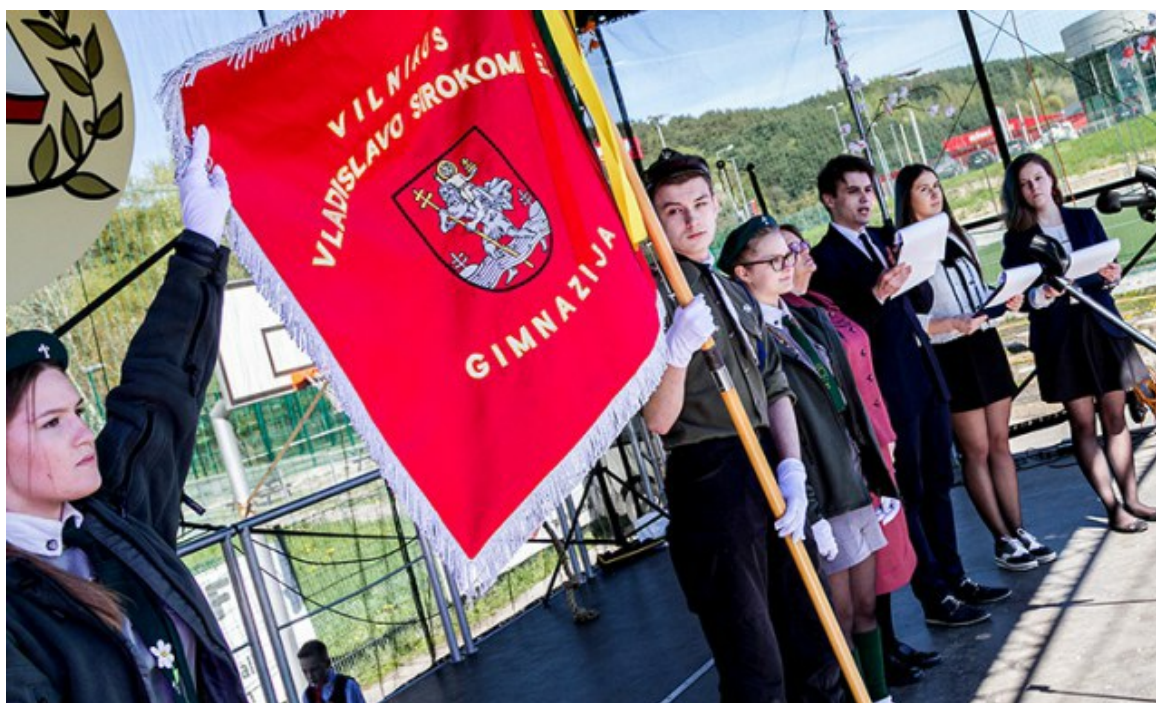
Na pierwszym miejscu w skali kraju pod względem wyników z chemii jest Gimnazjum im. W. Syrokomli