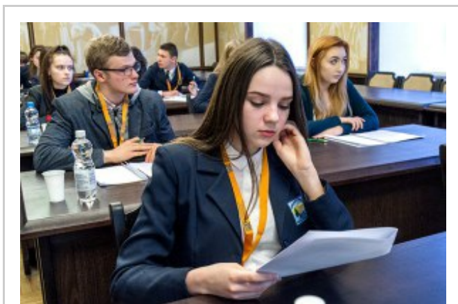
Wśród najlepszych szkół w każdej kategorii rankingowej są polskie – zarówno działające w Wilnie, jak i w mniejszych miejscowościach Wileńszczyzny